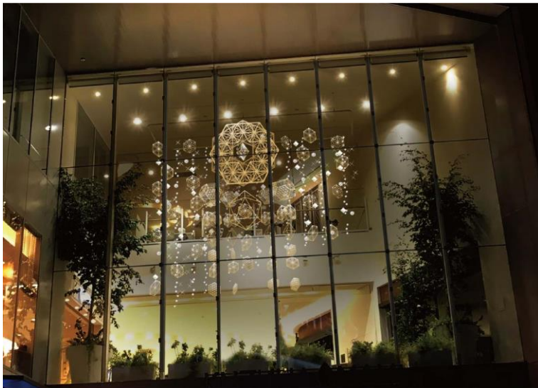
▲外からも見えるバトンに北欧のヒンメリをイメージした大型組子ヒンメリが登場