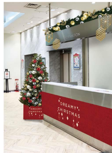
▲京阪シティモール1F