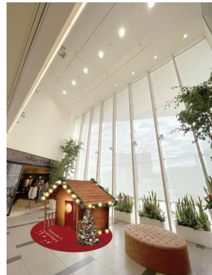
▲ヒンメリの下にはのぞくと楽しいタイニーハウスも

北欧の家庭で手作りされるヒンメリは「翌年の五穀豊穡や、家族の健康、幸せ」を願って飾られます。また大きければ大きいほど願いも大きく叶うとも言われていることから、コロナ禍で未だ平穏とは程遠いいま、来年こそは平穏な日常が訪れますようにと私たちの願いを込めて…、縁起のいい和柄の組子を大きなヒンメリに見立てた装飾にデザインしました。