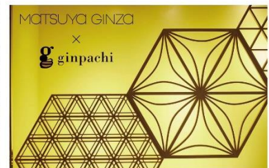
▲松屋銀座で使用されていた時の様子