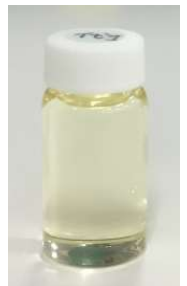
③リサイクル絶縁油