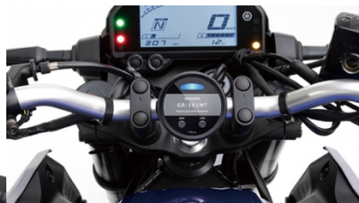
市販の汎用マウントステー使用時