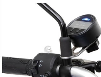
付属のマウントステー使用時