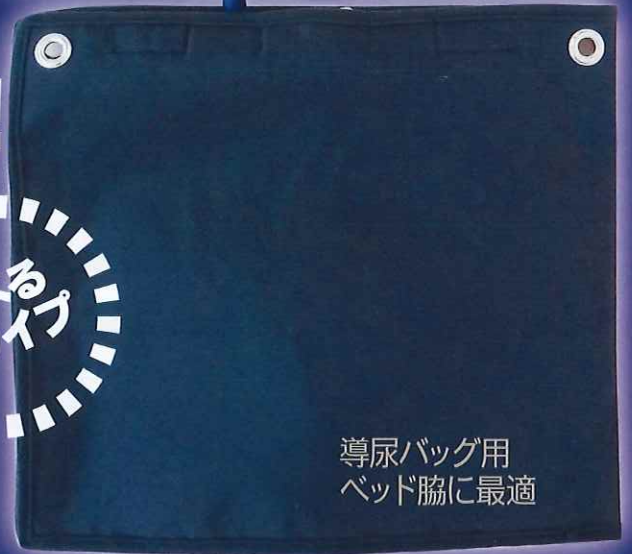
導尿バッグ用 ベッド脇に最適

導尿バッグに上から被せて使用します。 シリカクリンによりニオイとムレを解消。 安心の日本製 KB セーレン社製抗菌糸を使用!! 100回洗濯しても抗菌効果は持続し、 繰り返し使用出来て経済的です。