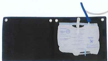
バッグをカバーで包みこむ