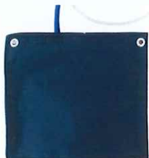
ベッド脇に最適取り扱いも簡単