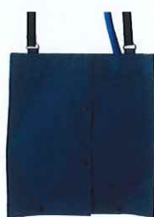
肩にかけて 動きもスムーズに