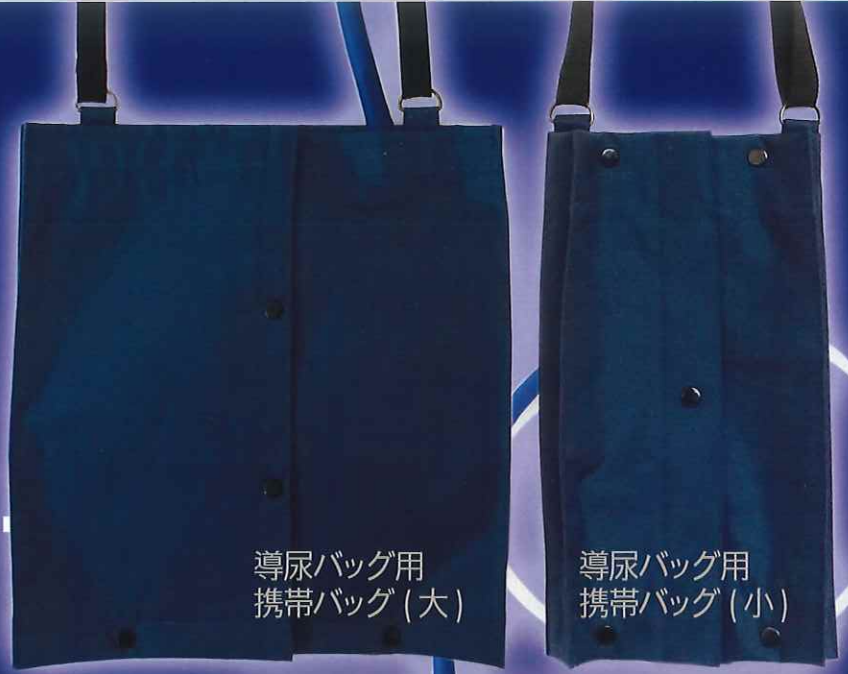
導尿バッグ用 携帯バッグ(大)