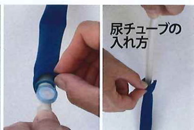
尿チューブの 入れ方