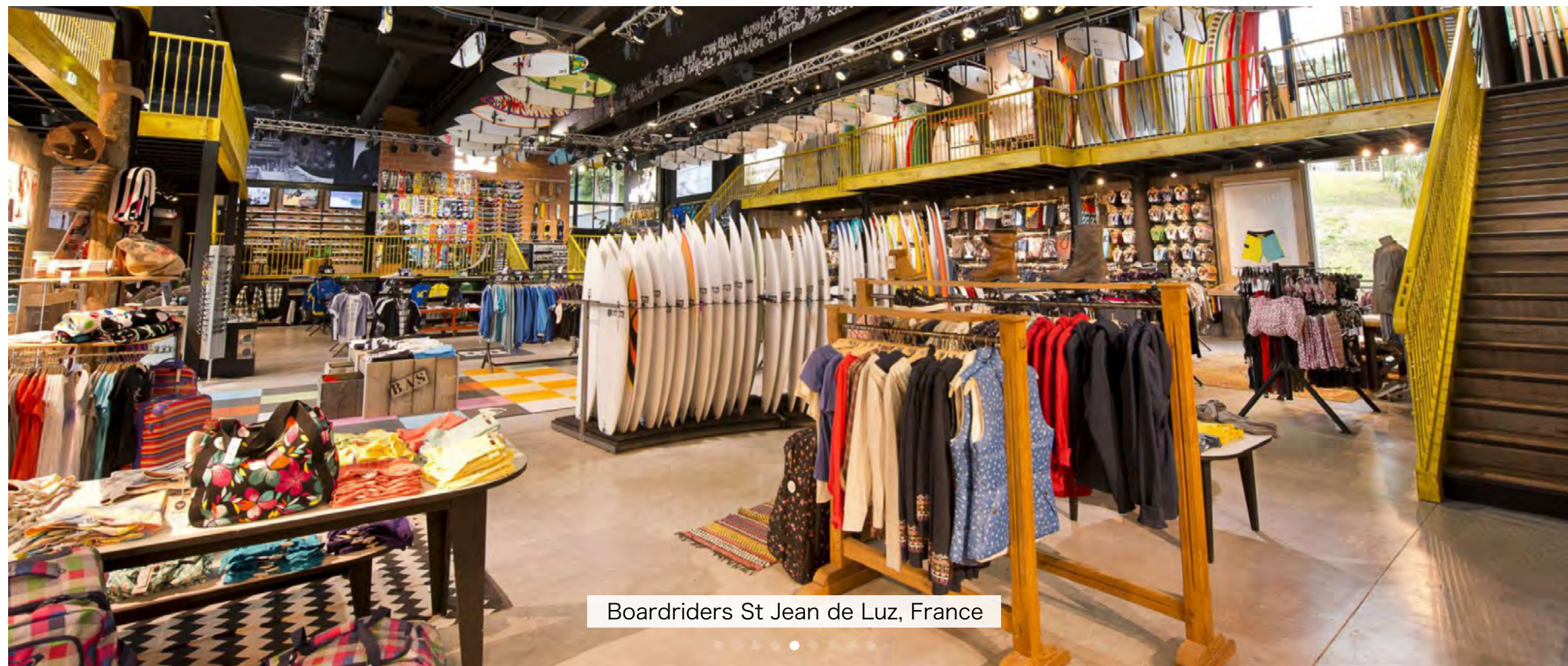
Boardriders St Jean de Luz, France