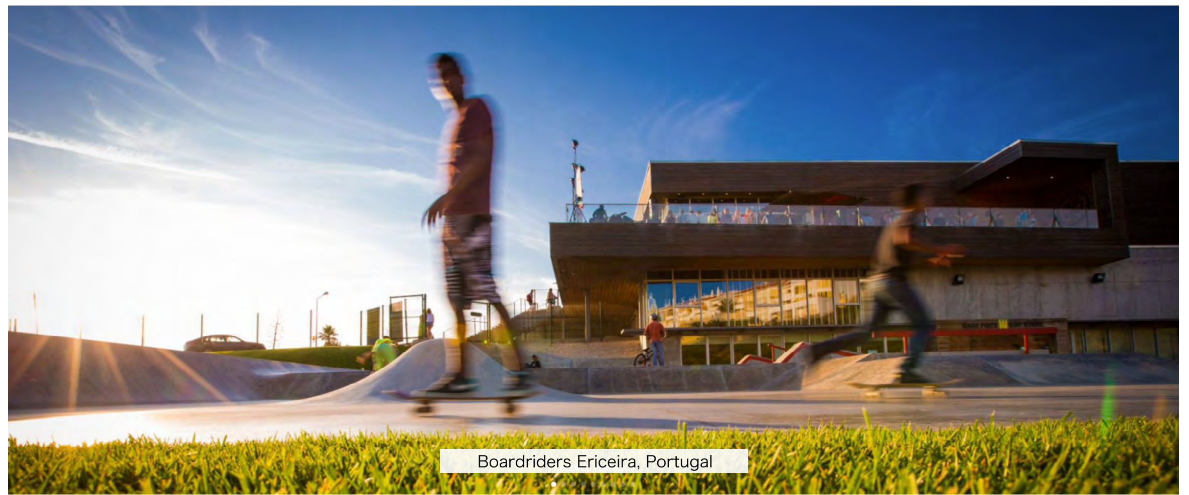
Boardriders Ericeira, Portugal