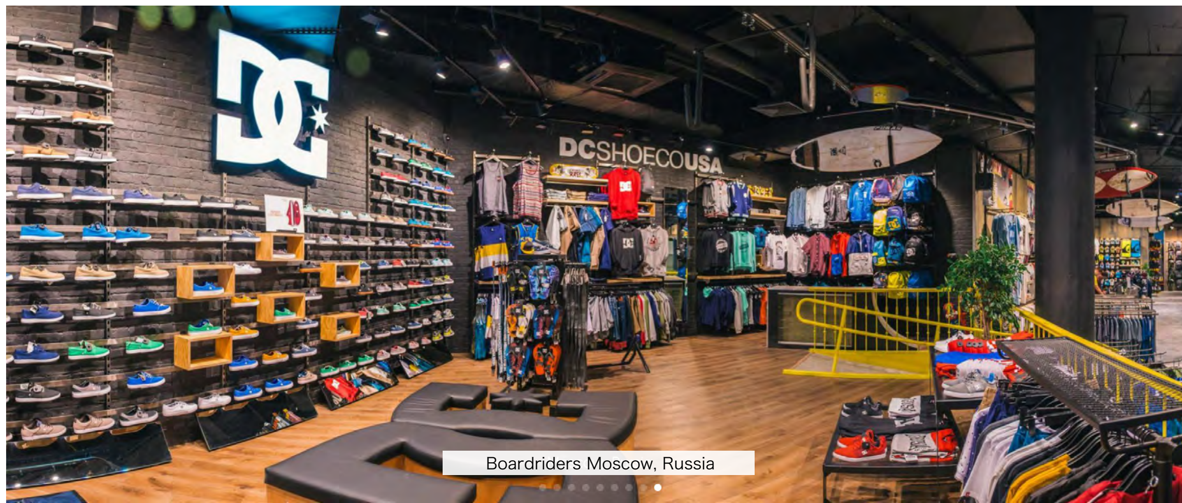
Boardriders Moscow, Russia