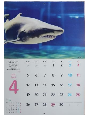
※画像は昨年のものです。

※スーベニアショップ「モラモラ」、コレクターズショップ「ガレオス」、リラックスカフェ「マーメイド」は営業いたします。フードコートは営業いたしません。