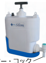
フィルター・コック