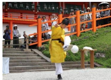
【けまり体験 イメージ】