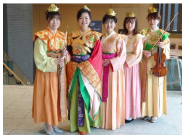
【万葉衣装 イメージ】

時 間：10月 9日（土） ①12：00～12：20 ②15：00～15：20 10月10日（日） ①13：30～13：50 ②16：00～16：20 内 容：万葉衣装をまとい、聖徳太子、蘇我入鹿、推古天皇を模した3名のアクターたちが公園内でグリーティングを行い、来場者との記念撮影も実施します。