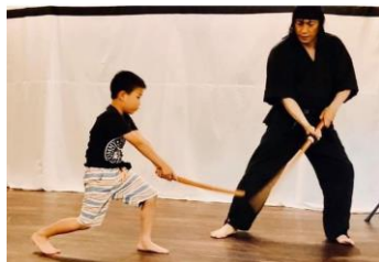
【殺陣体験 イメージ】