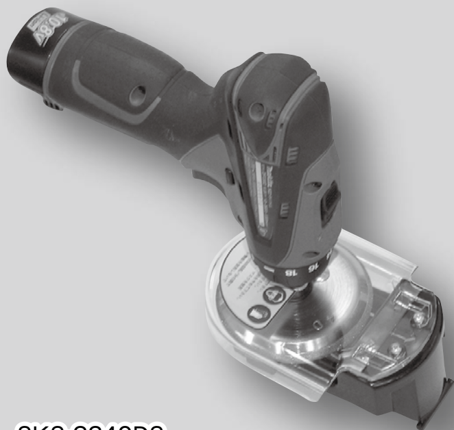
SKS-2340DS SKS-2350DS (充電ドライバドリルタイプ) ¥31,000 (税抜)