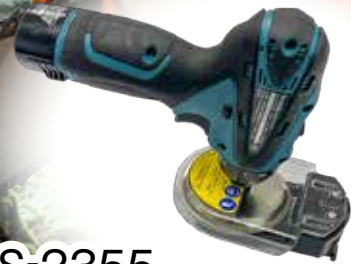
SKS-2355 (やすり径 φ5.5mmタイプ)