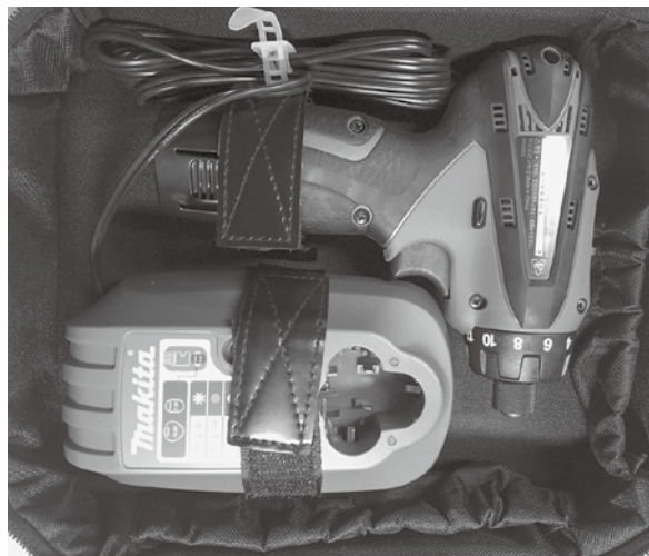
DF030DWSP (ソフトケース) マキタ 充電式ドライバドリル バッテリー1ヶ付