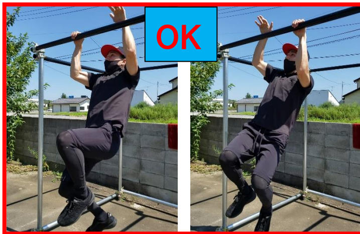
⑤手をバーより上にあげて掴みなおすのはOK

⑥3分に達した選手がいた場合、主審の掛け声とともに懸垂開始。懸垂回数で順位を決定する。