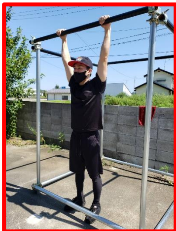
①パイプを掴み、地面に足を付けた状態で構え