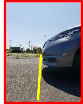
③車両の先頭がゴールラインに達したらゴール