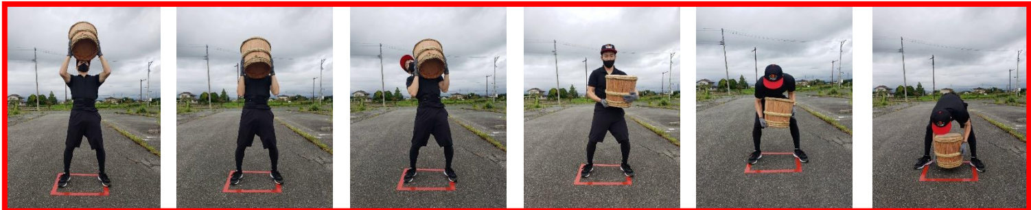
⑦酒樽を定位置に置くことが出来れば、記録はそのまま。落としたり倒した場合は記録なし。