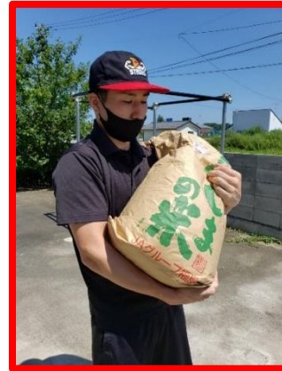
③米袋の持ち方は胸の前で抱える持ち方のみ