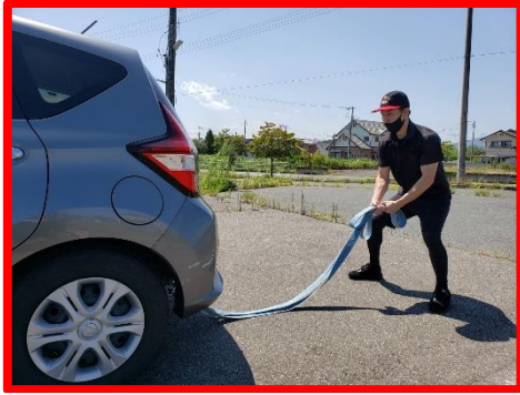
①ロープを持って垂らした状態で構え