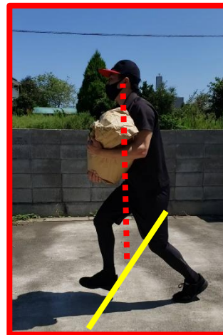
⑦ゴールラインに胸が達した時点で記録とする