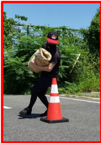
⑤パイロンでUターン ※2 往復あります。