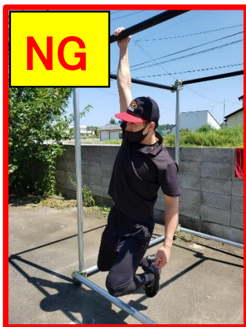
④片手で休むのは禁止