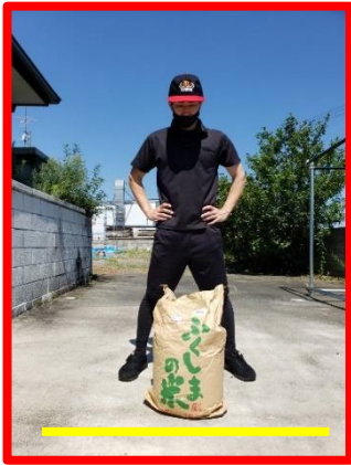
①スタートライン手前の定位置に米袋を置いた状態で構え