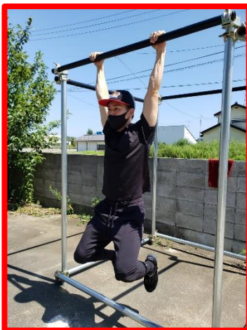
②スタートの合図で足を地面から離す