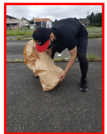
⑦丁寧に定位置に戻して終了