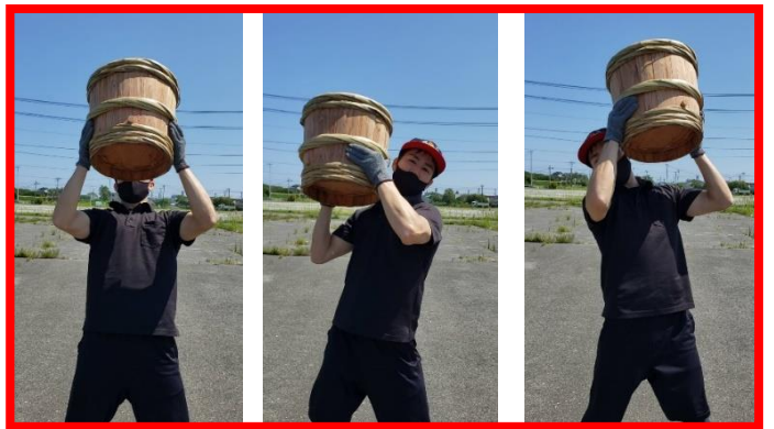
⑧酒樽が目線より下がったら計測終了