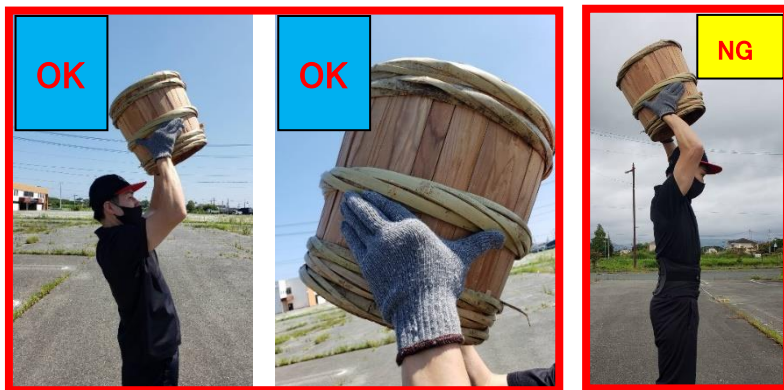
⑥酒樽の持ち方は写真の持ち方に限定 ※前後にバランスを崩さないよう注意