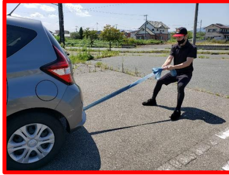
②スタートの合図でロープを引く