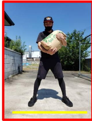
②審判の合図で米袋を抱える