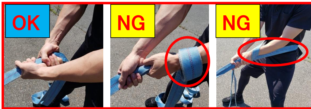
④ロープの持ち方は単純に握るのみ。 腕や体に巻き付けるのは禁止。