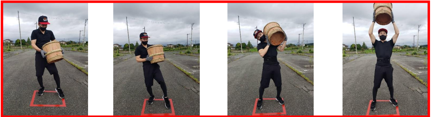
④酒樽を落とさないように丁寧に持ち上げる