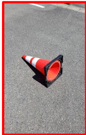
⑥パイロンを倒した場合は記録にプラス 5 秒