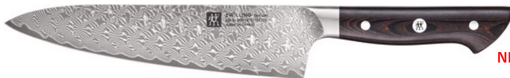
NEW シェフナイフ 200mm