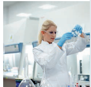
ライフサイエンス

基本的なアプリケーション すべての導電性および非導電性液体の測定 ▪ 酸とアルカリ ▪ 洗浄剤・溶剤 ▪ 液化炭化水素 (例: ベンゼン、トルエン)