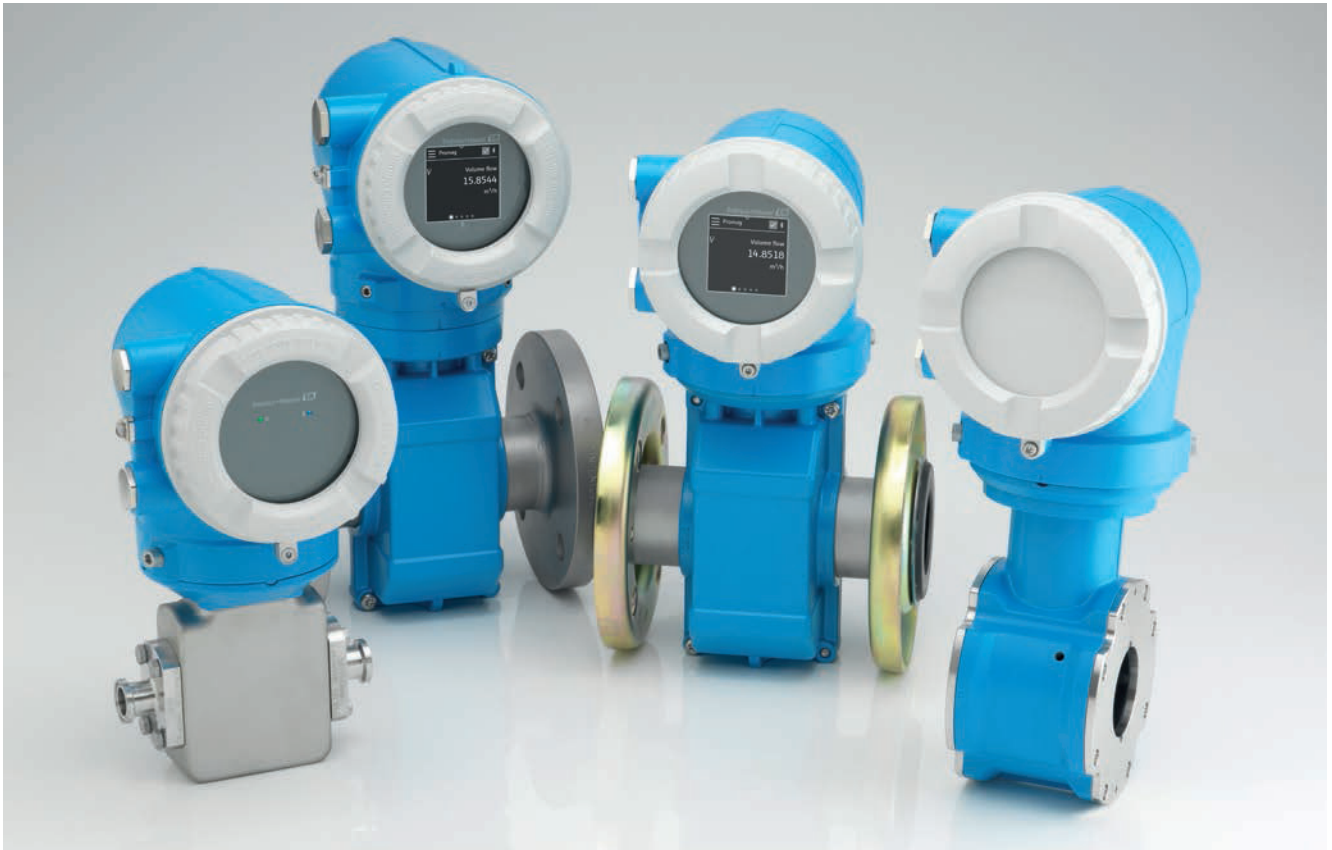
Proline 10変換器の各種バリエーション(左から右へ):LED表示,LCDディスプレイ(タッチスクリーン付き/なし)、ディスプレイなし。