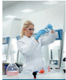
ライフサイエンス