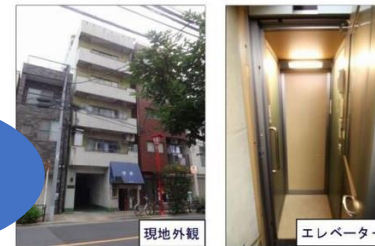
現地外観 エレベーター