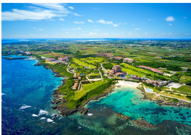
『シギラセブンマイルズリゾート』 全景

沖縄本島より南西に約 300 km、世界屈指の美しい海と自然に囲まれた、琉球文化が息づく宮古島。『シギラセブンマイルズリゾート』は、宮古島の南岸に沿って広がる約 100 万坪の敷地に、カジュアルスタイルからラグジュアリーまで、幅広いニーズにお応えできる 9 つのホテル、20 店舗以上の多彩なレストラン、ゴルフ場、ビーチや温泉など、リゾートステイの醍醐味のすべてが揃う、まさに南国の楽園です。