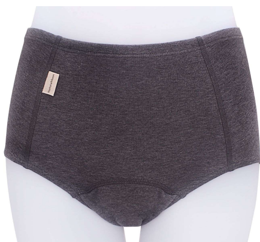
お腹やヒップをすっぽり包み込んでくれる深穿きタイプ

また、温かくお過ごしいただけるよう、お腹やヒップをすっぽり包み込んでくれる深穿きタイプになっています。