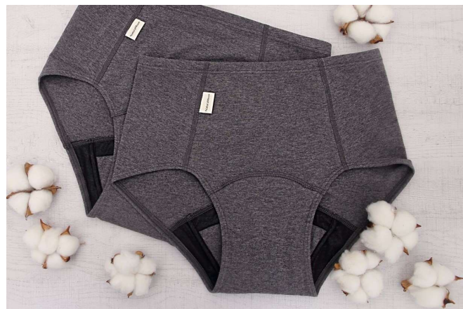
デリケートゾーンがあたるクロッチ部分にもオーガニックコットン素材を採用

縫製の際は、肌にあたる部分ができる限りフラットになる縫い目にし、擦れると刺激になりやすいタグは表側に縫い付けるなどの工夫をしています。デリケートな素肌に着用するものだからこそ、生地の編み立てから縫製まで日本製にこだわり、肌へのやさしさ、心地よさを追及しました。