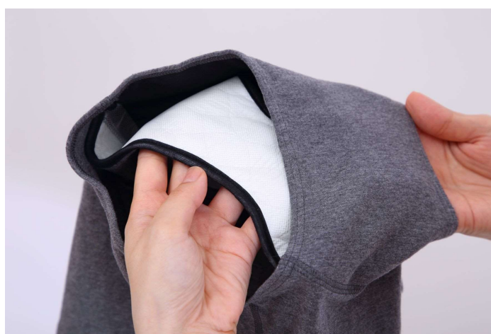
クロッチ部分が二重構造のためナプキンと併用可能