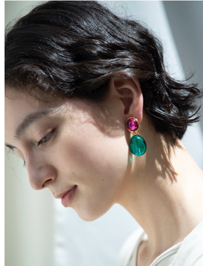
エニグマティック