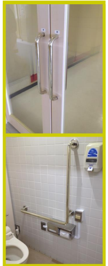
ドアハンドル・手すり 製作 株式会社ユニオン

試験機関：一般財団法人 北里環境科学センター 報告書番号 北環発2017_0052号、北環発2017_0063号 試験方法：フィルム密着法