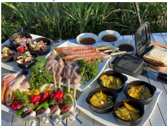
ランチBBQメニュー例

【販売サイト】 https://www.tablecheck.com/shops/hotel-hiei-bbq/reserve