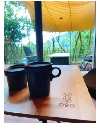
グランピングルーム内の コラボアイテム