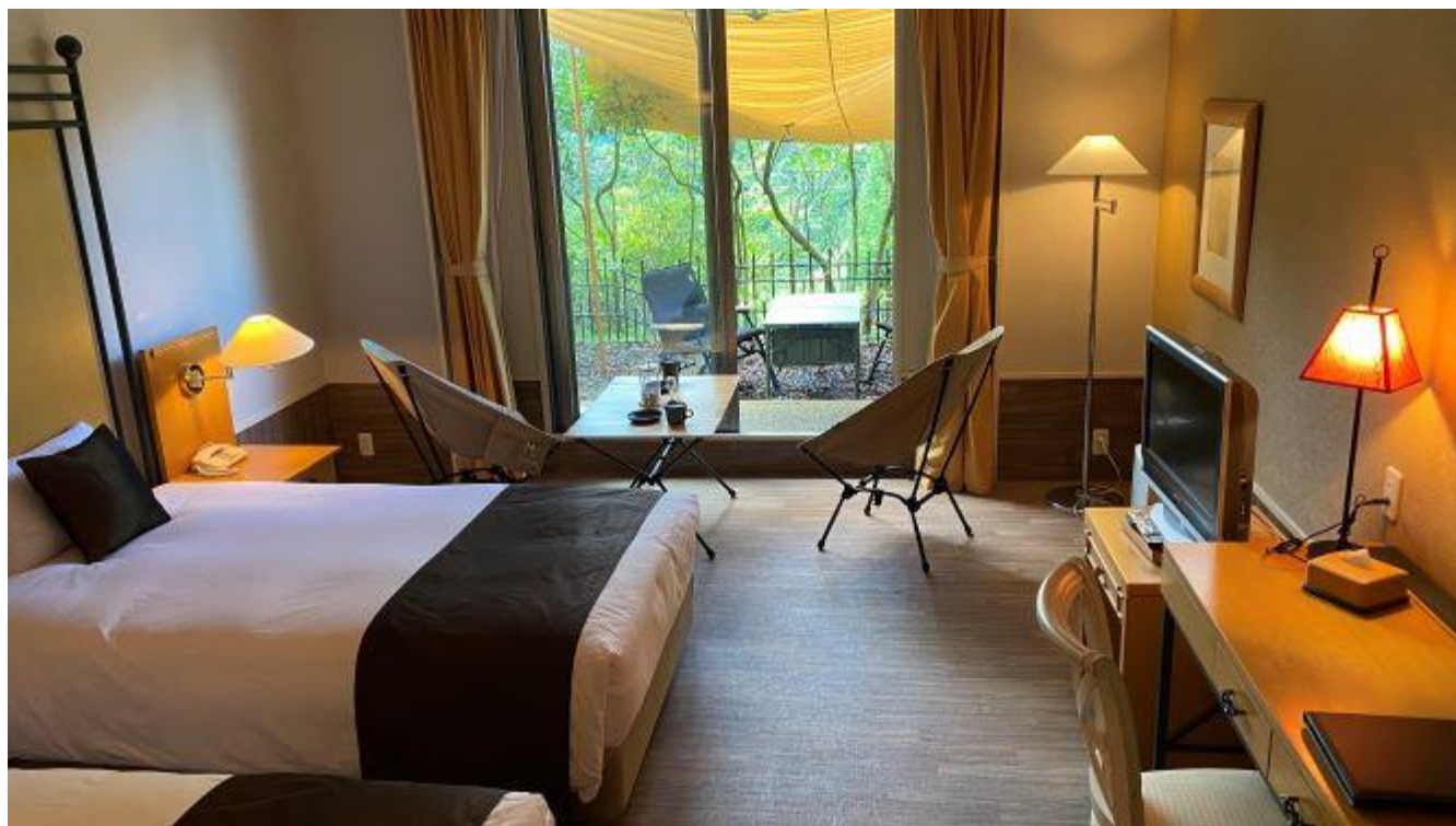
DOD コラボレーション グランピングルーム

グランピング気分を演出するため、「アウトドアをワクワクするソト遊びに」をコンセプトにした関西の人気アウトドアブランド「DOD」とのコラボレーションを実現。同社のジミニテーブルやスゴイッスなどを客室内にレイアウトしました。さらに、ベランダにはチーズタープにユトリチェア、グッドラックテーブル、ランタンを配し、都会では体験できないひとときを提案いたします。敷地内のBBQエリアにも「DOD」のアイテムを設置。「DOD」商品は、WEBサイトをメインに販売しているため、実物に触れられる機会が少なく、実際に使用できる本プランは大変貴重な体験となります。比叡山内の大自然の中、四季感じながら手ぶらで気軽にアウトドアの食事や人気ブランドに囲まれたキャンプ気分を存分にご堪能ください。