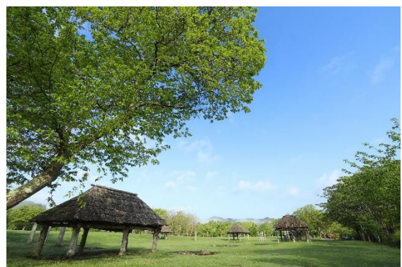
▲御所野遺跡 中央ムラ

御所野遺跡は、今から約5,000～4,200年前の縄文時代中期後半の遺跡で、国の特別史跡として通年公開されている岩手県を代表する人気観光スポットです。本年7月27日に、御所野遺跡を含む「北海道・北東北の縄文遺跡群」について、国連教育科学文化機関（ユネスコ）により世界遺産への登録が正式に決定いたしました。