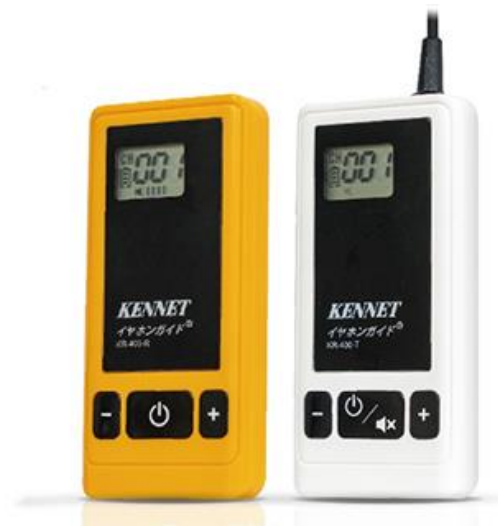
▲イヤホンガイド KR-400 (左) 受信機 (右) 送信機

イヤホンガイドは、観光地を中心に年間約70万人にご利用いただいている送信機と受信機からなる無線ガイドレシーバーです。1997年の発売以来、観光地をはじめ、工場・施設見学、美術館・博物館、セミナー会場、国際会議での同時通訳、スポーツ会場での解説など幅広いシーンで利用されています。旅行関連市場では90%以上の国内シェアを有しており、「新型コロナウイルス感染防止対策ツール」としても各業界から好評いただいております。