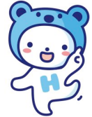
マスコットキャラクター ジェルくん

2011年の冷却ジェルマット業界No.1のシェアを誇るヒラカワが今年さらにはパワーアップ。インパクトのあるテレビCMをはじめ、さまざまな広告を新たに展開して参ります。マスコットキャラクターにはお子様や女性に愛される”ジェルくん”を起用し、各売り場や広告でキッズ&ファミリー層へ訴求いたします。