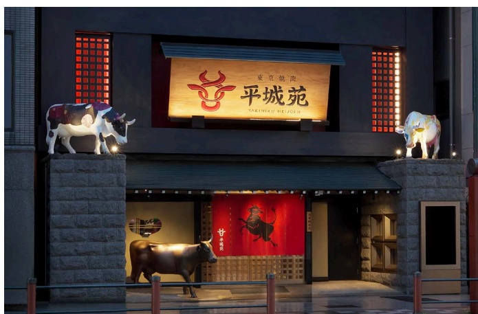
「東京焼肉 平城苑 浅草総本店」