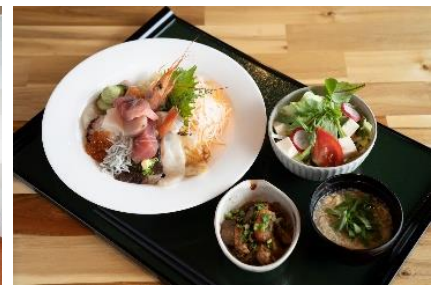
レストラン メニュー例