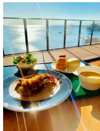
開放的な海を眺めながらの食事（イメージ）

資料請求： https://mazeran-web.com/sajima/request-for-materials/