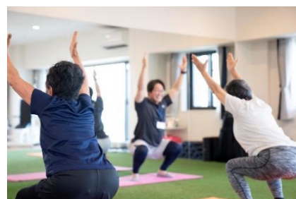
フィットネスプログラム(イメージ)

さらに、Apple Watch や体組成計などで取得したヘルスケアデータをもとに、医師が入居者に対し定期的に個別のアドバイスをを行い、それと連動して、当施設がサポート提案を行うことで生活習慣の改善を促進します。