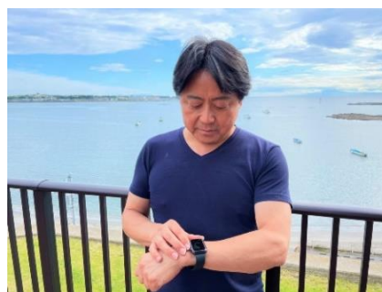
Apple Watch 着用によるヘルスデータ取得(イメージ)

また、当施設が提供するノルディックウォーキングやヨガ、スマホ教室などのイベントに加え、入居者自らの特技や経験、趣味などを生かしてイベントの実施や講師になることも可能です。