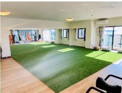
フィットネスルーム