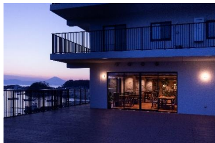
テラスからは相模湾と富士山を一望（夕景）