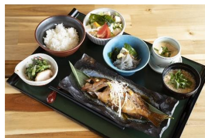
入居者向け特別メニュー(一例)

健康を増進するには、「食事」「運動」「社会参加活動(多世代交流)」の3つの要素が不可欠です。本モニター生活は、海を見晴らす美しい景観の環境下で、おいしく栄養バランスのよい食事を堪能し、フィットネスで適度に身体を動かし、館内・屋外イベントなどで多世代交流をするとして、日常生活を通して心身ともに健康増進させていきます。