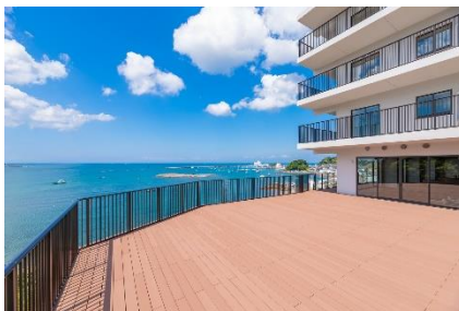
テラスからの眺望一例