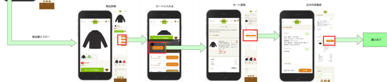
▲mozoPLUS・お客様の注文から購入画面の遷移 (イメージ)