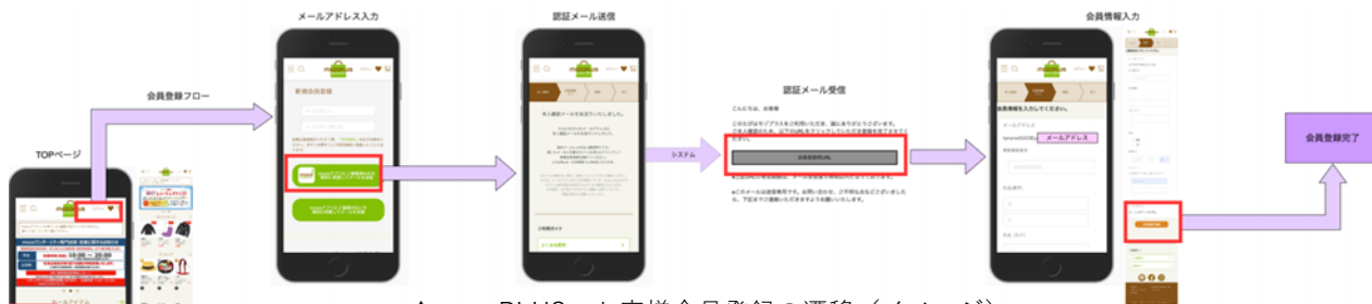
▲mozoPLUS・お客様会員登録の遷移 (イメージ)