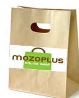
▲mozoPLUS オリジナル包材 ※画像はイメージです

mozoPLUS の大きな特徴の一つに、館内物流の荷捌所との連携があげられます。商品は館内物流を担うワールドサプライ社専属スタッフによってセンターへ集められます。mozoPLUS のオリジナル包材に複数店舗の商品を同梱することでおまとめ配送を可能にし、お客様の複数回受取のストレスを軽減する仕組みを導入しました。