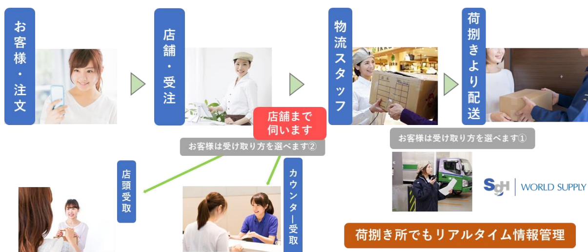
▲mozoPULS・注文からの配送（イメージ）

※カウンター箇所：当施設内 4F に設置予定 対応時間：10：00～18：00 （一部無人対応）