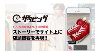
▲動画投稿「ザッピング」

動画投稿のストーリー型オンライン接客ツール「ザッピング」を搭載。専門店スタッフによる動画・ストーリー投稿からの購買を可能にしたほか動画ならではのメリットを活かし、ザッピング動画を SNS へシェアするなど、現代に合わせたスマートフォン仕様になっています。