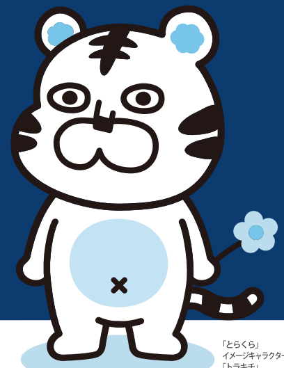
「とらくら」 イメージキャラクター 「トラキチ」

「とらくら」は、 クラウドに特化した 完全オンラインで学べる エンジニアリングスクールです！