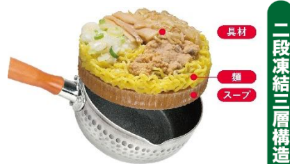
※写真は「お水がいない 札幌味噌ラーメン」です。

凍結スープの上に麺・具材を重ねてさらに冷凍させる「二段凍結三層構造」により、スープをお湯で割る手間もなく、お鍋で温めるだけの手軽さが特長。専門店さながらの味をご家庭でお手軽にお楽しみいただけるキンレイの人気シリーズ商品です。