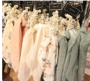
ヘアアクセサリ 800 円