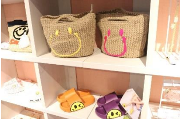
上：にこちゃんバッグ 5,000 円 下：にこちゃんサンダル 2,500 円