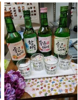
チャミスル4種 飲み比べセット