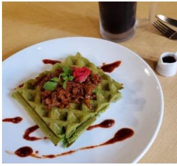
黒毛和牛プルコギワッフル