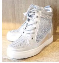
ハイカットスニーカー 4,000 円