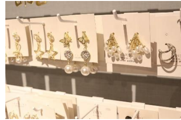
ピアス 500 円