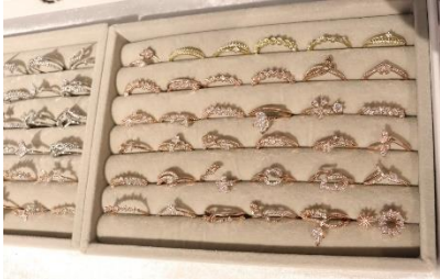
指輪 500 円 ※価格は全て税込