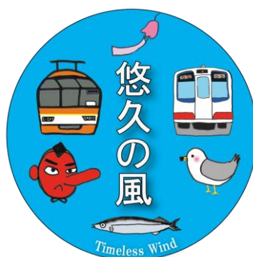
ヘッドマークデザイン