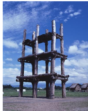
▲三内丸山遺跡 （左）掘立柱建物 （右）大型掘立柱建物跡

三内丸山遺跡は、今から約5,900～4,200年前の縄文時代の日本最大級の集落跡で、国の特別史跡として通年公開されている青森県を代表する人気観光スポットです。本年5月26日には、三内丸山遺跡を含む「北海道・北東北の縄文遺跡群」について、国連教育科学文化機関（ユネスコ）の諮問機関、国際記念物遺跡会議（イコモス）から世界遺産一覧表に「記載」することが適当である旨の勧告がなされ、7月に正式決定される見通しです。