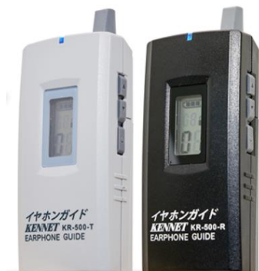
▲イヤホンガイド KR-500 (左) 送信機 (右) 受信機