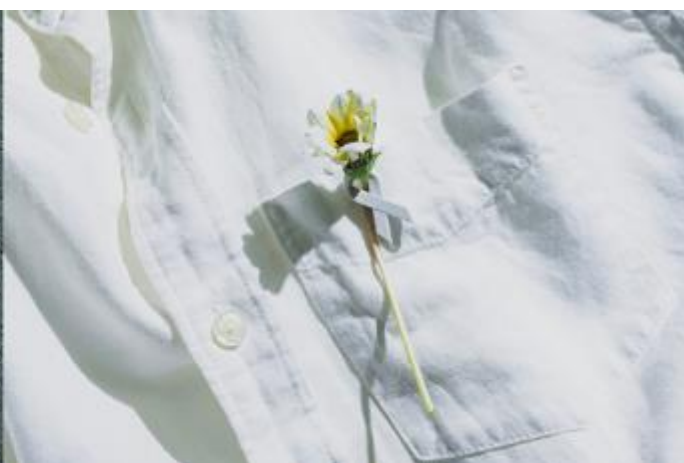
NAGORI®の質感を生かしたブーツニール