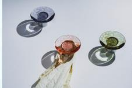
太陽の光で柄が浮かび上がる 「GEOMETRIX」