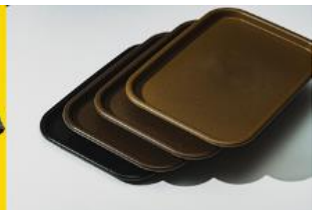
地域特有の食品残渣などのロスを 相容化技術でコンパウンド 「GoTouch Compounds」