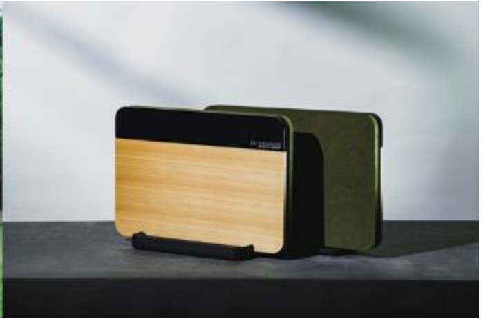
超親水コート材ノストラ®による落書機能付き 「321 IDEA BOARD」