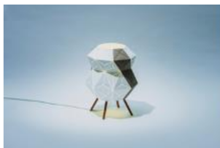
光の透過が美しいランプシェード 「POLYISM」