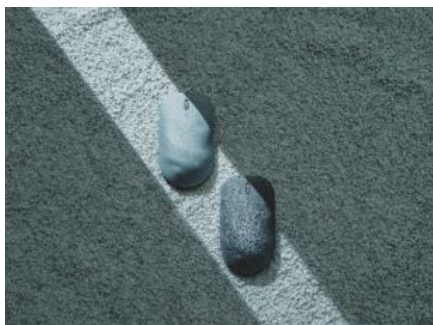
新たに抗菌機能を持つことが判明した NAGORI®による石庭のようなマウス