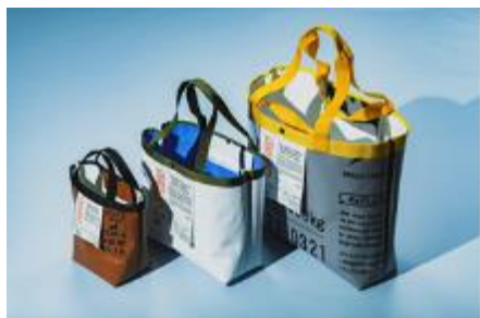
15年後のフレコンバッグの アップサイクル・バッグ (NFTによるトレーサビリティ機能付き)