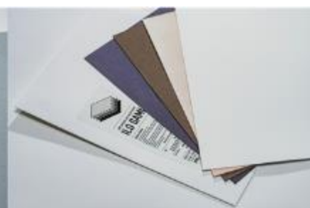
天然染料によるポリオレフィン染色実験 「ILO GAMI」