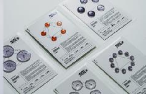
太陽の光で色が変わるボタン 「SHIRANUI Button」