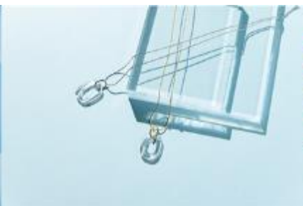
メガネレンズの アップサイクル・グラスホルダー 「SUPERELLIPSE」