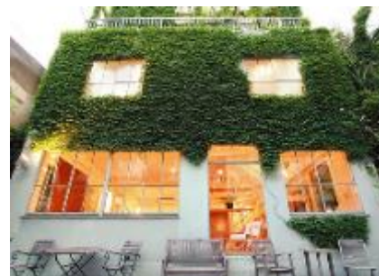
ライトボックススタジオ青山