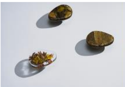
落ち葉を植物由来ウレタン 「スタビオ®」で封入した 「SLOW PLAY」