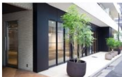
ライトボックスギャラリー