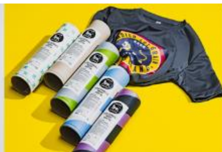
繊維産業で発生する多量の糸の紙管を パッケージに再利用 「Indigo Tiger Tee」