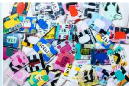
レジ袋の アップサイクル・パスケース