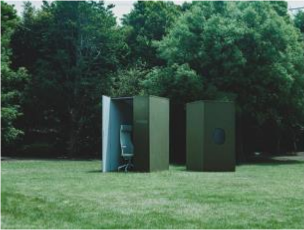
素材 x 音響技術を活かした 「321 IDEA CAVE」