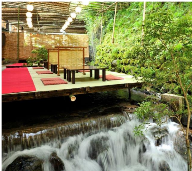
「貴船の川床」イメージ