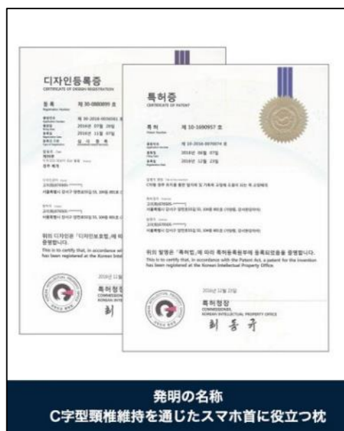
発明の名称 C字型頸椎維持を通じたスマホ首に役立つ枕