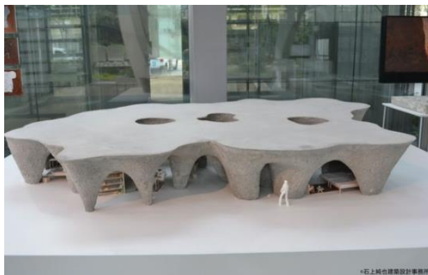
パリ「カルティエ財団現代美術館」個展で展示された模型

1万年前からありそうで、1万年後にもそこにありそうな2021年秋、山口県宇部市に開業予定の『maison owl(メゾン・アウル)』は、「シェフの隠れ家にゲストを招き、ロマンを感じる時を過ごしていただきたい」という思いで造る“まるで洞窟”のような空間で、1日1組限定で泊まることもできます。