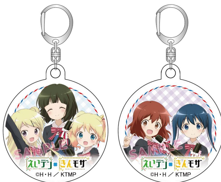
アクリルヘッドマークキーホルダーのイメージ