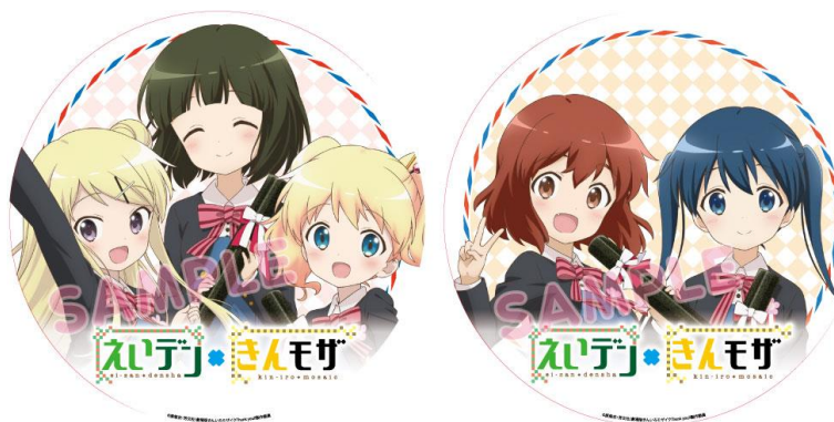
ヘッドマークのイメージ