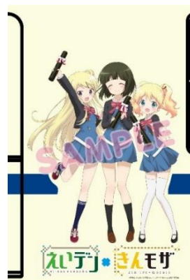
コラボラッピングのイメージ