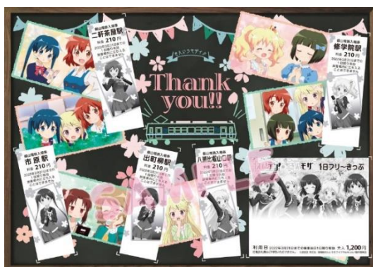
コラボきっぷのイメージ