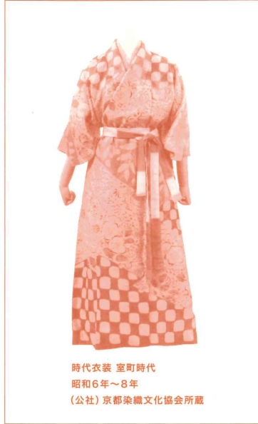
時代衣装 室町時代 昭和6年～8年 (公社)京都染織文化協会所蔵