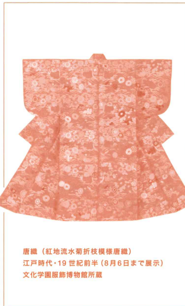
唐織 (紅地流水菊折枝模様唐織) 江戸時代・19世紀前半(8月6日まで展示) 文化学園服飾博物館所蔵