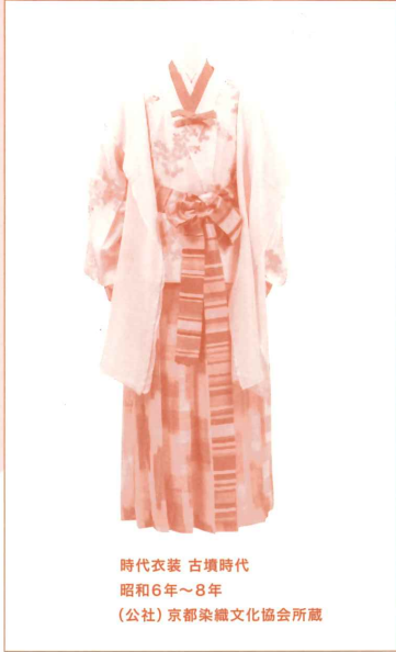
時代衣装 古墳時代 昭和6年～8年 (公社)京都染織文化協会所蔵

平安遷都以降、貴族や武家、そして裕福な町人の華やかで贅沢な衣生活を支えたのが、都の工人たちでした。応仁の乱で京が一時灰燼に帰すことがあっても、工人たちはこうした苦難を乗り越え、新たな染織技術を次々に生み出して現代に至っています。しかしその間、京都の染織業が一時期低迷することもありました。昭和6年(1931年)、京都の染織業の振興を図るために行われたのが京都染織祭でした。本展覧会では、当時の京都の染織技術を結集して復元された、古墳時代から明治時代初期に至る女性の衣服を展示して日本の女性の服装の1500年をたどるとともに、当館所蔵の江戸時代後期から昭和時代初期の優品を通して京都の染織技術の真髓を感じていただきたいと思います。