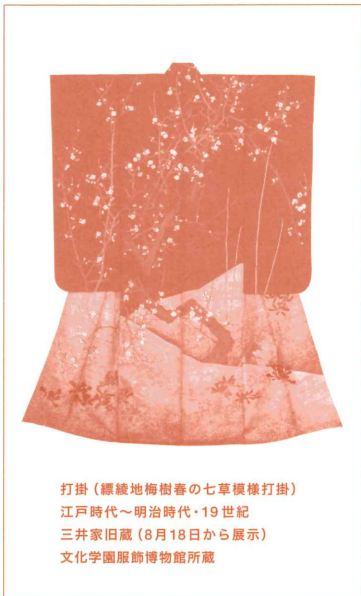
打掛 (緋綾地梅樹春の七草模様打掛) 江戸時代～明治時代・19世紀 三井家旧蔵(8月18日から展示) 文化学園服飾博物館所蔵