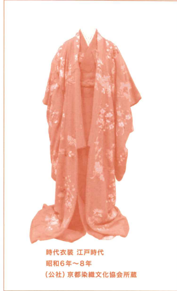
時代衣装 江戸時代 昭和6年～8年 (公社)京都染織文化協会所蔵