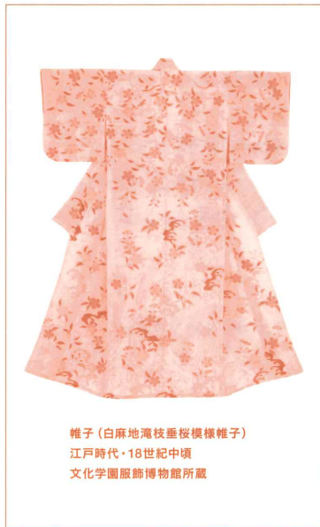
帷子 (白麻地滝枝垂桜模様帷子) 江戸時代・18世紀中頃 文化学園服飾博物館所蔵