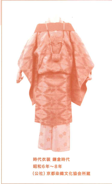
時代衣装 鎌倉時代 昭和6年～8年 (公社)京都染織文化協会所蔵