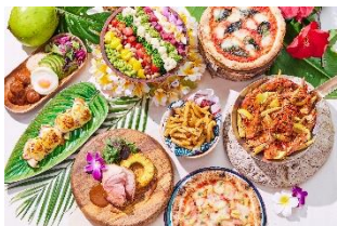
ハワイでの定番メニューも豊富にご用意