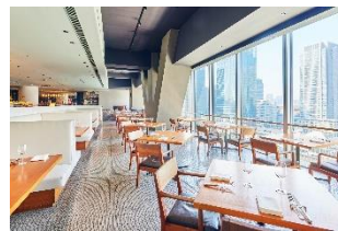
大きな窓から東京駅を一望

【 XEX TOKYO 】 所在地: 〒100-6701 東京都千代田区丸の内1-9-1 大丸東京13F 電話番号: 03-6266-0065 / ランチタイム: 11:00~16:00 (L.O.:15:00) 平日: 3,800円(税込サ無) 休日: 4,500円(税込サ無) ※100分制となります