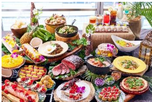
アジアンリゾート ブッフェ

アジアエスニックには欠かせないスパイスやハーブを取り入れ、フレッシュフルーツをふんだんに使用し、女性に嬉しいヘルシーさが魅力のアジアンブッフェをご用意いたしました。ほどよい甘酸っぱさがクセになるタイ風シーフード春雨”ヤムウンセン”やスパイスシーとココナッツの甘い香りが絶妙なバターチキンカレーなど、食欲をかき立てる料理の数々。オリジナルトロピカルモクテルとの相性は抜群です。