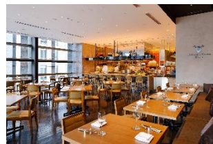
オープンキッチンが賑やかな店内

【 XEX 日本橋 】 所在地: 〒103-0022 東京都中央区日本橋室町2丁目4-3 YUITO/日本橋室町理研ビル4F 電話番号: 03-3548-0065 / ランチタイム: 11:30~15:30 (L.O. 14:00) 平日: 2,980円(税込) 休日: 3,980円(税込) ※90分制となります