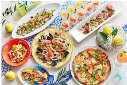
色鮮やかなブッフェ料理

地上180mのパノラマビューに囲まれた空間で楽しむブッフェのテーマは「地中海リゾート」。パエリアやシーフードマリネなど新鮮な魚介類やオリーブオイルを贅沢に使用し、ハーブやフレッシュレモンで爽やかに仕上げました。