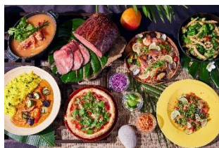
スパイスやハーブを使用した料理の数々

アジアエスニックには欠かせないスパイスやハーブを取り入れ、フレッシュフルーツをふんだんに使用し、女性に嬉しいヘルシーさが魅力のアジアンブッフェをご用意いたしました。ほどよい甘酸っぱさがクセになるタイ風シーフード春雨”ヤムウンセン”やスパイスシーとココナッツの甘い香りが絶妙なバターチキンカレーなど、食欲をかき立てる料理の数々。オリジナルトロピカルモクテルとの相性は抜群です。