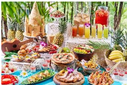
ハワイアンリゾートブッフェ

ハワイアンリゾートをテーマにガーリックシュリンプやアサイーボウルなどハワイならではの定番メニューを取り入れたブッフェをご用意。 ライブスタイルで焼き立てをご提供するハワイアン・パンケーキはオリジナルのホイップクリームやトロピカルフルーツのお好みのトッピングでお楽しみいただけます。 店内は都内にいるとは思えない落ち着いた空間と、大きな窓から差し込む光が心地良い空間を演出しています。