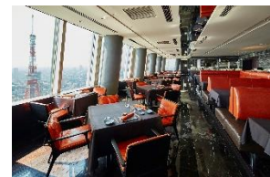
東京タワーを一望できる絶景