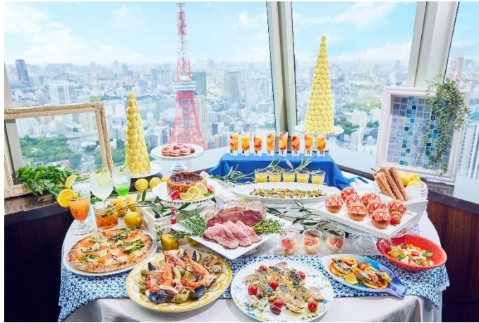
XEX ATAGO GREEN HILLS / 地中海リゾートがテーマの Resort Buffet