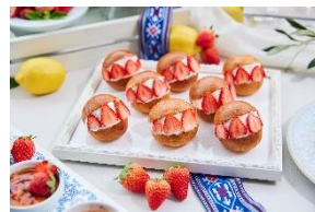
今話題の“マリトッツォ”