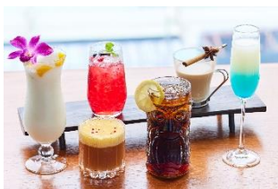
XEXオリジナル トロピカルモクテル