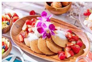
ハワイアン・パンケーキ

ハワイアンリゾートをテーマにガーリックシュリンプやアサイーボウルなどハワイならではの定番メニューを取り入れたブッフェをご用意。 ライブスタイルで焼き立てをご提供するハワイアン・パンケーキはオリジナルのホイップクリームやトロピカルフルーツのお好みのトッピングでお楽しみいただけます。 店内は都内にいるとは思えない落ち着いた空間と、大きな窓から差し込む光が心地良い空間を演出しています。