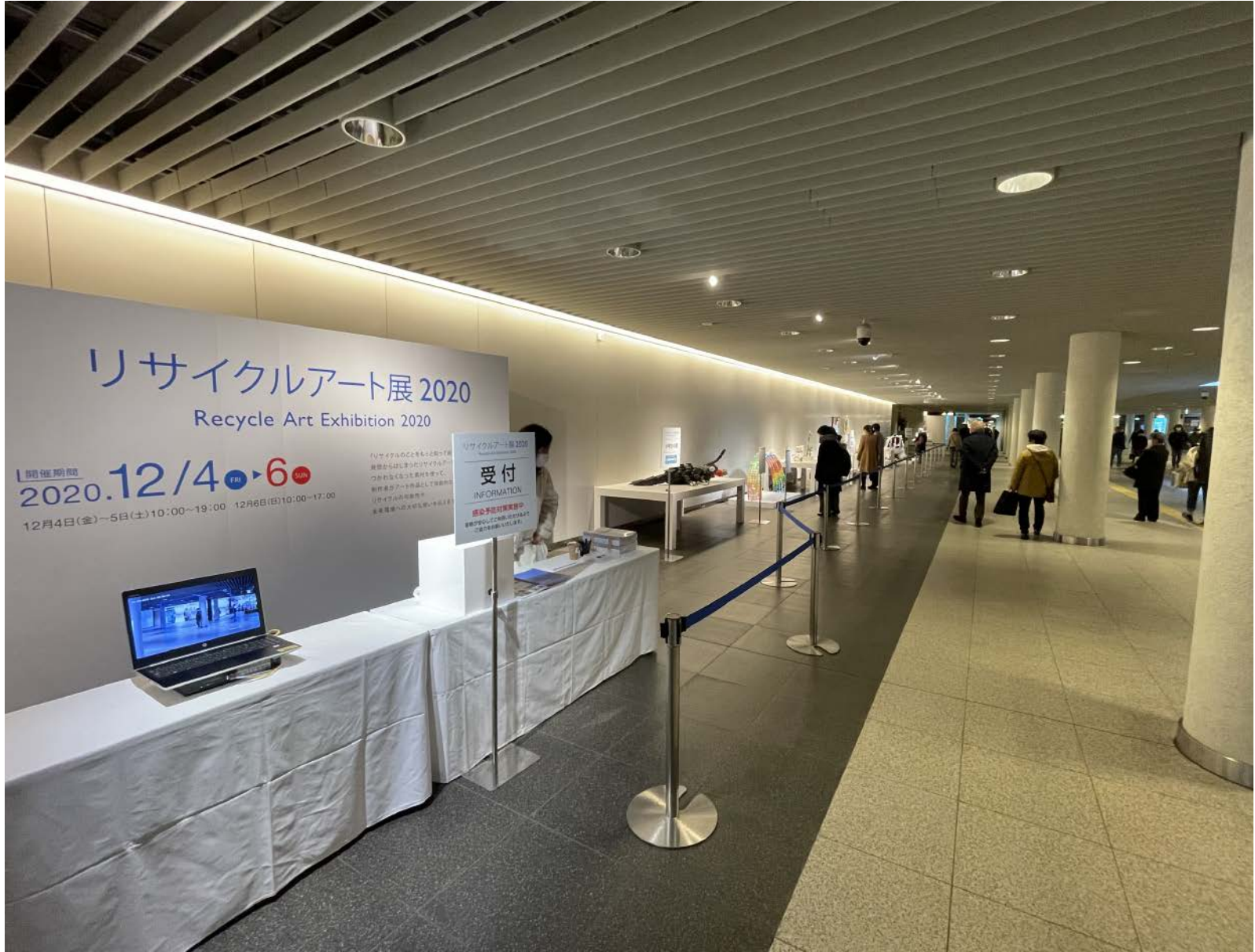
△リサイクルアート展2020