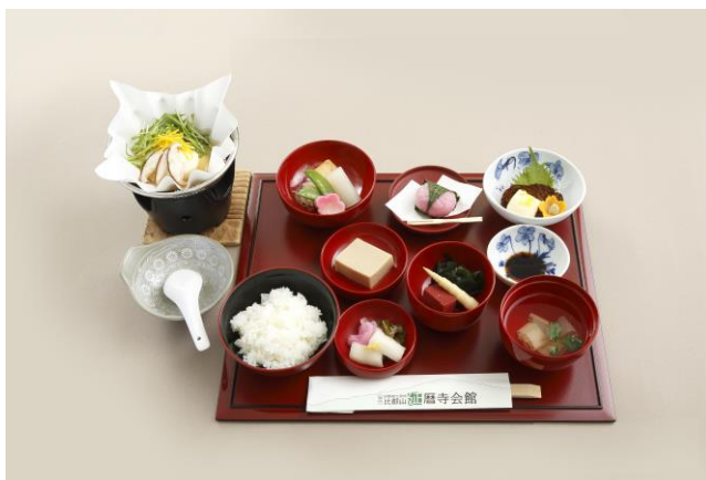
▲延暦寺会館でのお食事 「精進懐石膳」