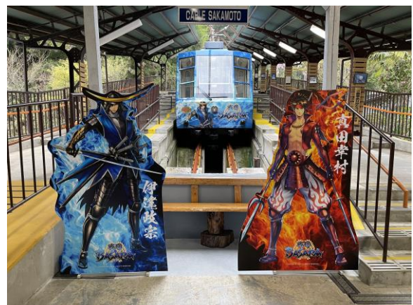
▲坂本ケーブル（BASARA ラッピング）