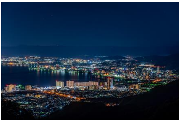
▲比叡山から望む夜景（大津市街地方面）