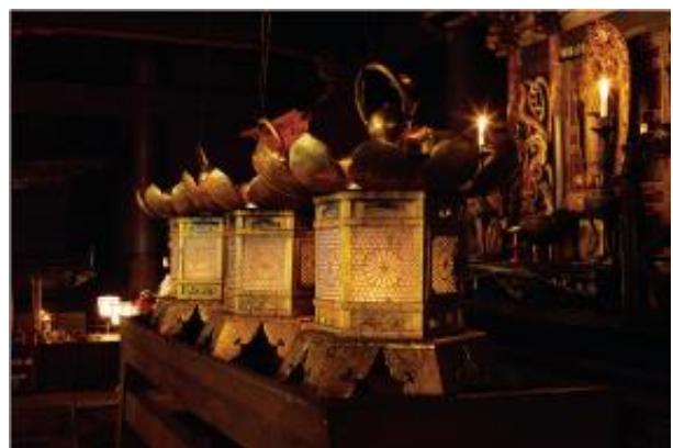
▲比叡山延暦寺の根本中堂（国宝）