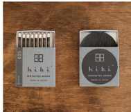
005 Tea tree

A slightly exotic fragrance with a rich and sensual sweetness. * For the times when you want to relieve tension and feel a deep sense of satisfaction.