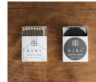
Japanese cypress (ひのき)

懐かしい静けさで、心を包み込む樹木の香りが、遠くまで心を穏やかに鎮め、澄んだ思考を取り戻したい時に。