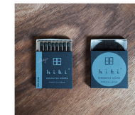
Oak moss (オークモス)

Awakening your inner-strength and deep wisdom with a cool fragrance of woods reminding you of the crisp air of a cedar forest