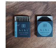
Cedar wood (シダーウッド)

杉林の澄んだ空気を思わせる、クールで澄んだウッド系グリーン調の香りが、強さとステイラスな世界へ。