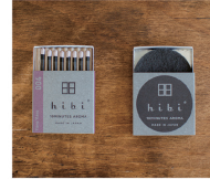
004 Ylang Ylang

A fragrance that blends the sweetness of a rose with a green note. * For the times when you want to restore the balance of an insecure spirit.