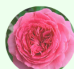
アドーア ロマンティク