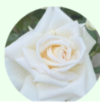
ワレム ドゥ メイアン