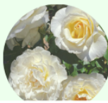
パール イヤリング