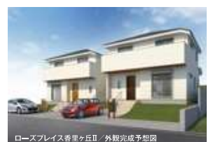
ローズプレイス香里ヶ丘Ⅱ 外観完成予想図