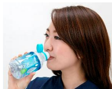
③キャップを持たずに飲める