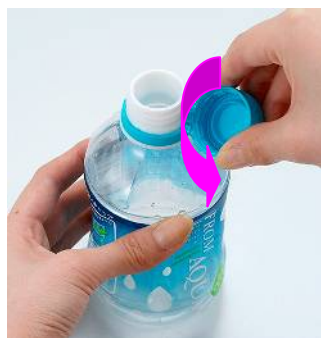
①キャップを持ってひねる