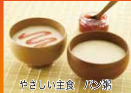
やさしい主食 パン粥