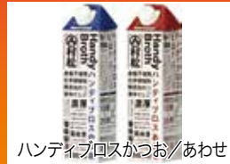
ハンディプロスかつお/あわせ