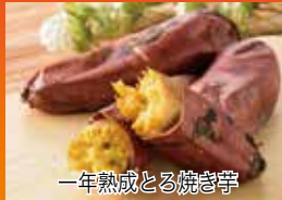
一年熟成とろ焼き芋