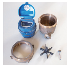
分別でリサイクル