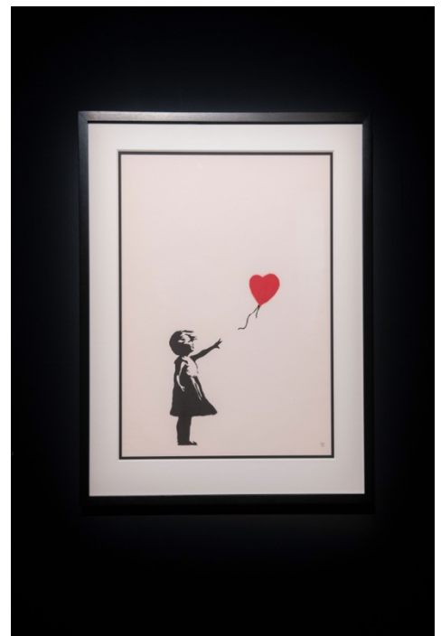
「LANDIC presents バンクシー展 天才か反逆者か」 作品名「ガール・ウィズ・バルーン」

「#WithSyria」キャンペーンのときには、ストリートに投影もされました。2018年には、ロンドン・サザビーズのオークションに出品された当作品が、オークション中にバンクシー自身の仕掛けた機械によって切り裂かれました。「シュレッダー事件」と呼ばれるこのエピソードは「美術史においてライブ・オークション中につくられた初の作品」と言われるようになり、後日、切り裂かれた作品は《ラブ・イズ・イン・ザ・ビン（愛はごみ箱の中に）》とバンクシー自身に名付けられました。