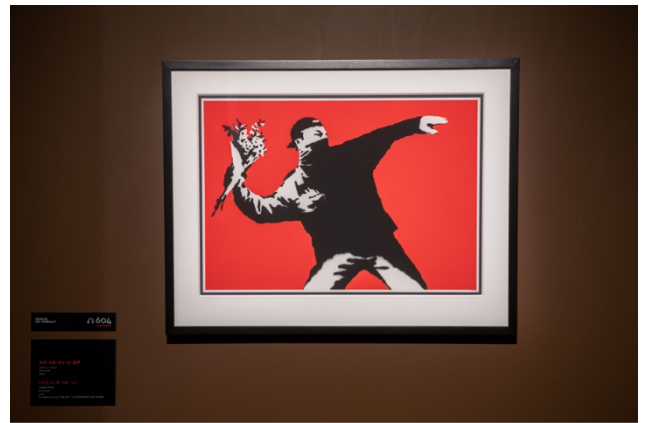
『LANDIC presents バンクシー展 天才か反逆者か』 作品名「ラブ・イズ・イン・ジ・エア」

パレスチナ・ヨルダン川西岸地区にあるベツレヘムの建物に描かれている作品《ラブ・イズ・イン・ジ・エア》。バンクシーは活動初期から現在にいたるまでパレスチナ問題に焦点を当てた作品を多数制作しており、本作はその初期作品のひとつです。作品に描かれている男は火炎瓶ではなく花束を持っており、パレスチナ人の人権を訴えています。本展覧会では「プロテスト(抗議)」というテーマの下で展示されています。