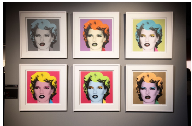
『LANDIC presents バンクシー展 天才か反逆者か』 作品名「ケイト・モス」

アンディ・ウォーホルの代表作《マリリン・モンロー》を引用した作品。当時もっとも有名だったモデルのひとり、ケイト・モスを描き、ウォーホルの時代から変わらずアート・マーケットが消費至上主義であることを指摘しています。大衆は、真の技能ではなくブランドや人気のあるイメージにお金を支払い、とっていることを浮き彫りにしています。初版にはブルーの作品が制作され、すぐさま人気に。その後、残りのシリーズもプリントされ、今回出品されている全6枚のシリーズとなりました。