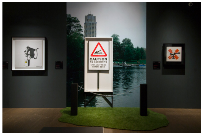
『LANDIC presents バンクシー展 天才か反逆者か』 作品名「ノー・スイミング」

本作品は、2006年にロンドンの中心部「ハイド・パーク」近くの湖水泳場に設置された標識の作品です。日常の風景に異質な物を置いたのにも関わらず、標識が変だ、とは気付かれず、3週間ほど誰にも注目されませんでした。バンクシーは、作品の中で世界共通語である道路標識や看板を多く取り上げています。自分の作品を通行人の目から故意に隠し、都市の風景にほぼ完全に溶け込ませるのです。日常で目にするものを疑わず、真実を見ようとせず、目の前の世界を考えもせず盲目的に信じてしまう人間や社会への批判をしていると解釈できる作品です。