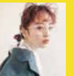
特別賞/COVID-19対策賞 La familia イツキ ケンタさん [chill bangs]