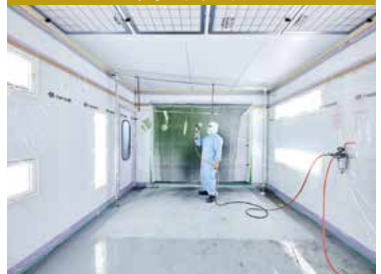
高性能大型クリーンブースW3500×D4080×H3075を設備。より高い品質が求められる製品に対し、確かな技術と検査基準でお応えいたします。