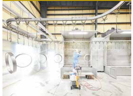
全長100mのラインを設備し、粉体塗装を中心に量産品の塗装に対応しています。最大でW3000×H1500(平板)まで塗装可能です。