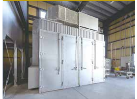
大型固定炉W4000×D3000×H3000を設備し、大型製品への塗装にも対応しています。