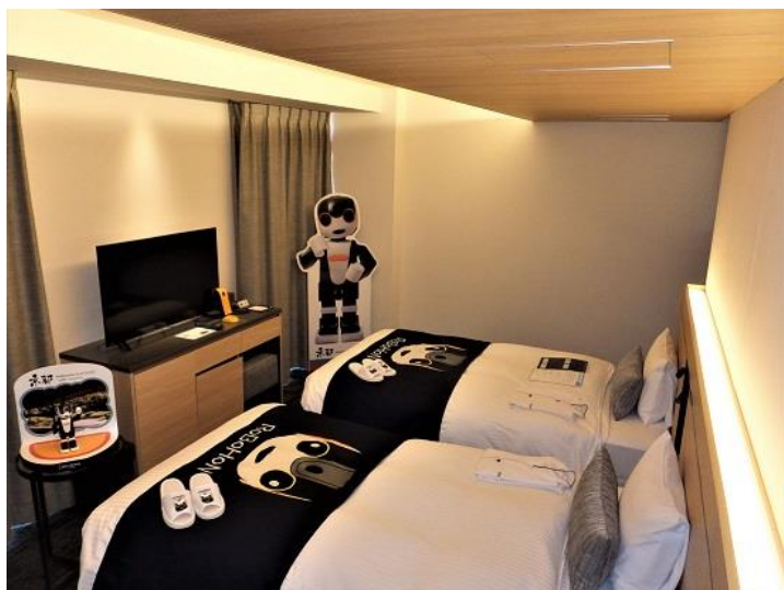
プレミアロボホンルーム