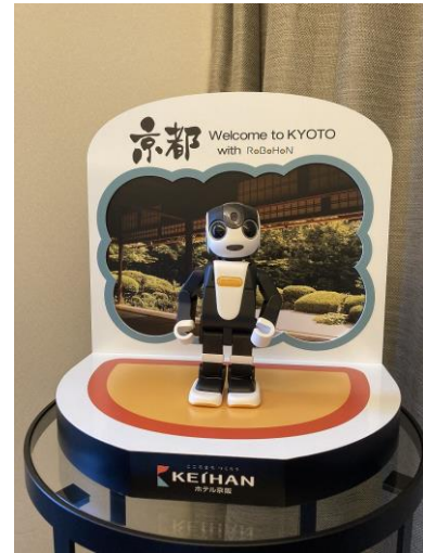
オリジナルのロボホン