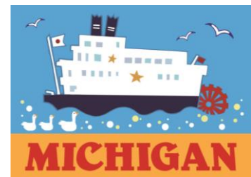
マグネットイメージ

ミシガンは1982年4月29日に就航しました。ミシガンのお誕生日を記念し、さらにこどもの日を祝して、ミシガンにご乗船いただいたお子様(小学生以下)にミシガンオリジナルマグネット(名刺サイズ/非売品)をプレゼントします。