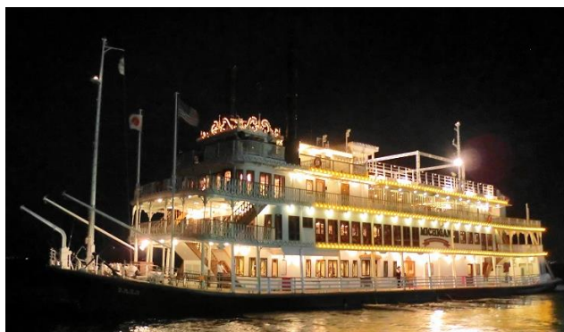
ナイトクルーズイメージ

ゴールデンウィーク期間中はデイトム運航のミシガン60(60分コース/2便)、ミシガン80(80分コース/2便)に加え、夕方のミシガン60(60分コース/1便)と夜のミシガンナイト(60分コース/2便、120分コース/1便)を運航します。ミシガンナイト120分コースではコース料理もお楽しみいただけます(お料理代4,000円～別途要/事前予約制)。