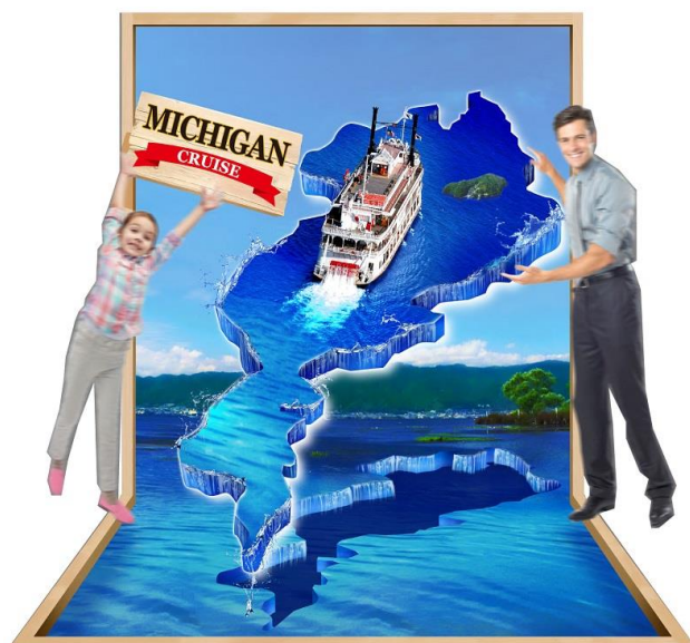
人物入りイメージ図