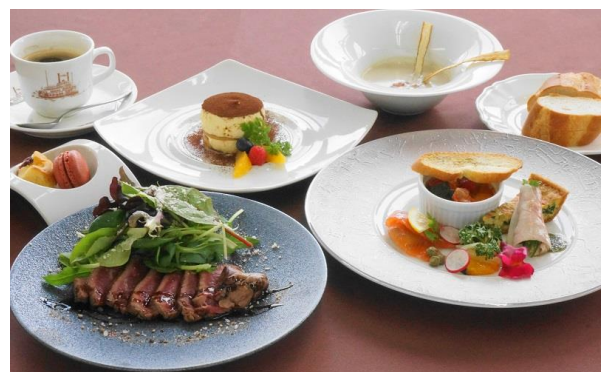
コース料理イメージ

今後の社会情勢により運航内容を変更する場合があります。最新情報はホームページをご覧ください。