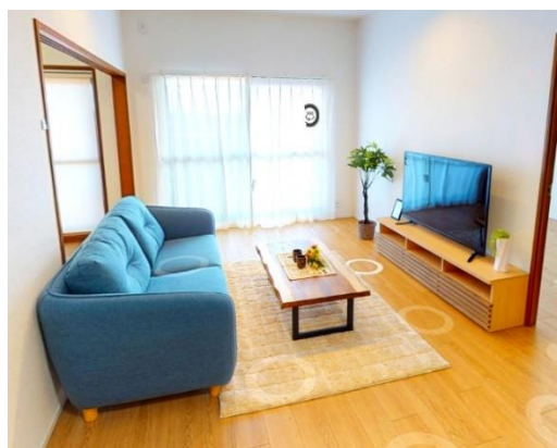
臨場感あふれる空間を360度閲覧可能