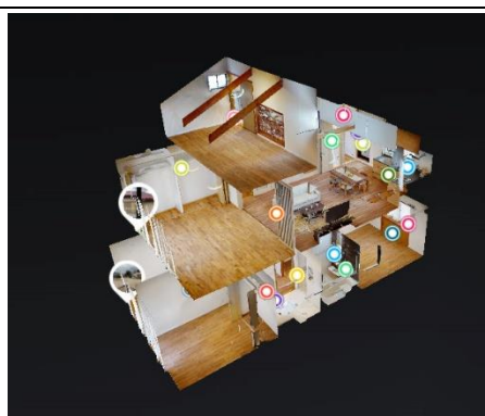
リノベーション戸建