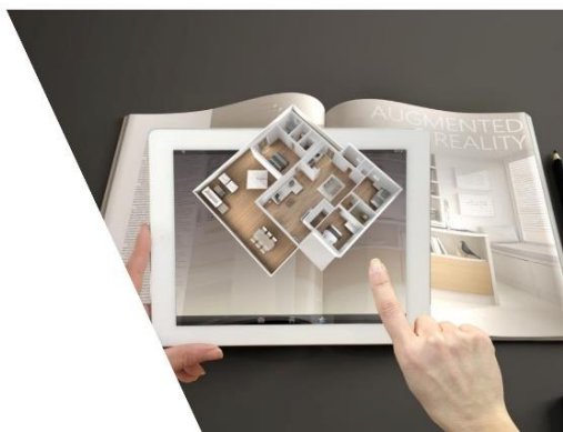
デバイスを選ばずに手軽に見学可能