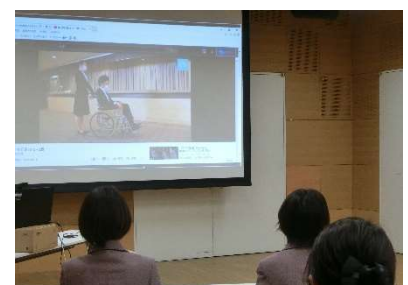
動画を活用し、様々な場面での対応を具体的に理解