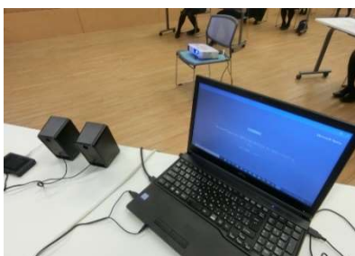
ネット環境・PC・プロジェクターがあれば実施可能