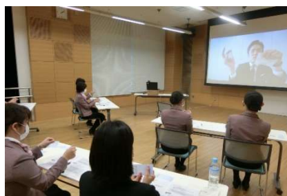
スクリーンに講師を映し出し、実践的なサービスのコツを伝授